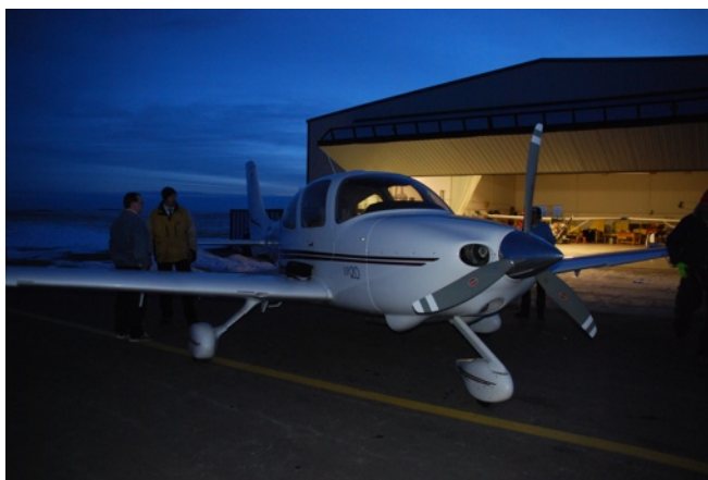
ontvangst Cirrus SR20