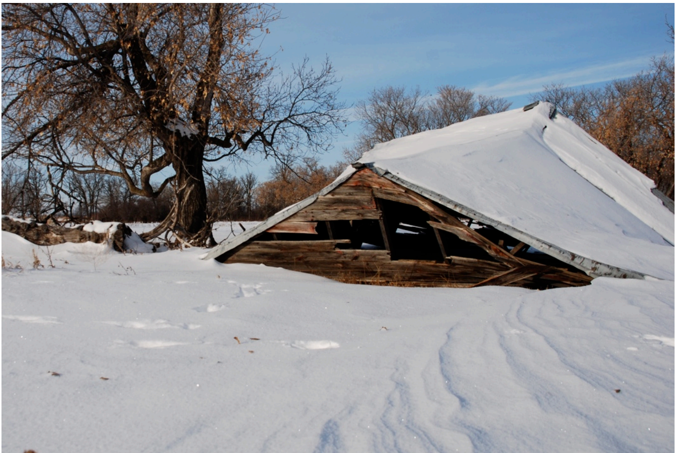
Typierend plaatje van de prairies

Marijn en Noortje -wij gouden u op de hoogte-